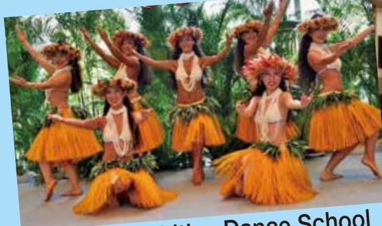
HEIARIKI Tahitian Dance School