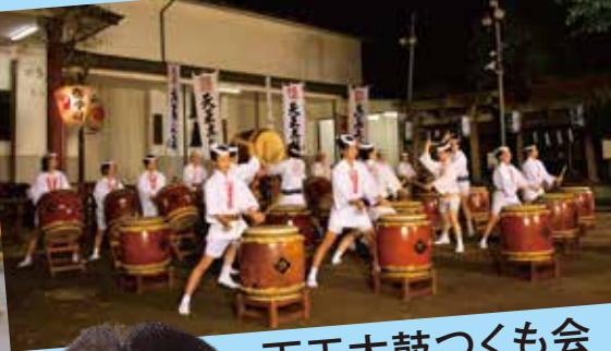
天王太鼓つくも会